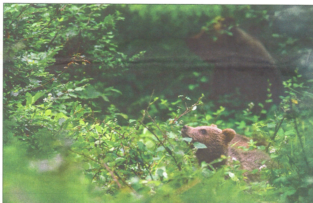
Medvedka ni nikoli daleč stran od mladičev. Če jih opazimo, se previdno umaknemo.