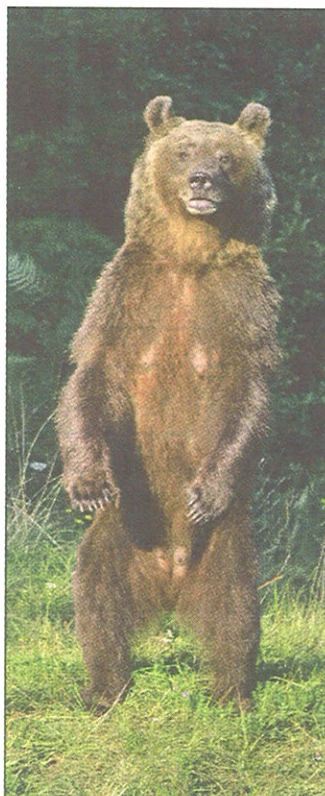
Medved z dvigom na zadnje noge ne izkazuje napadalnosti, temveč le preverja okoli-

tako tih, da bi medveda lahko presenetili. Opozorite nase predvsem pri prehodu skozi gosto vegetacijo in na nepreglednem območju. Občasno zažvižgajte, brcnite kamen ali udarite s palico po deblu, ni pa treba povzročati prekomernega hrupa, saj je to moteče za vse prebivalce gozda. Če kljub temu opazite medveda, ostanite mirni, opozorite nase z mirnim glasom in se počasi umaknite v smeri svojega prihoda. Pri umiku nikoli ne tecite! Medvedu pustite dovolj prostora za nadaljevanje njegove poti. Tudi medved se bo praviloma umaknil. Če medveda opazite, preden on opazi vas, se mu ne približujte in ga ne motite (na primer z metanjem kamenja). Če se medved dvigne na zadnje noge, s to držo ne izkazuje napadalnosti, temveč le preverja okoli-